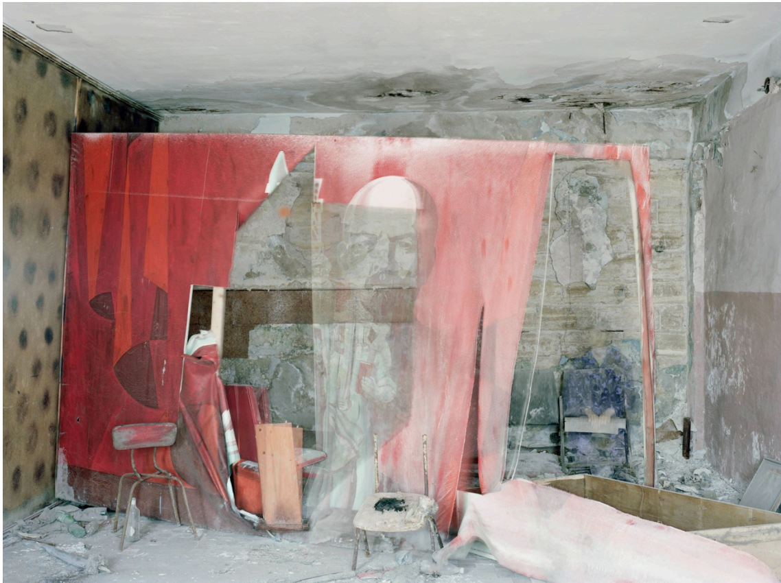
Andrej Pirrwitz, Good Bye Lenin , 2012