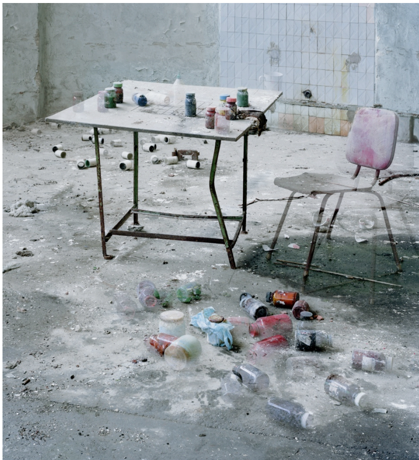
Andrej Pirrwitz, Chess Table , 2017