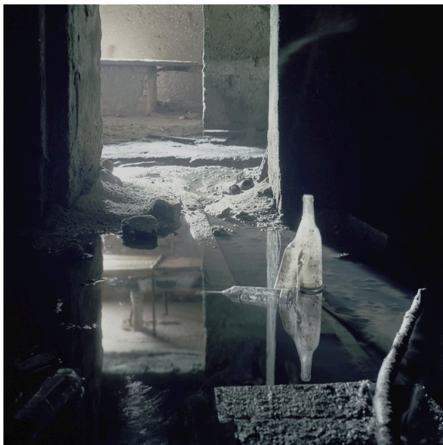
Andrej Pirrwitz, Schiffe versenken I , 2013