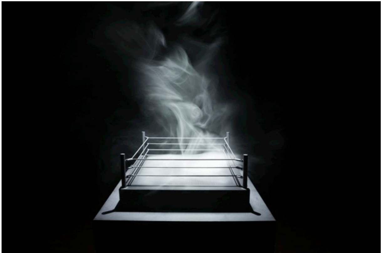
Mioon, Ensemble (Ethics Business) , 2014