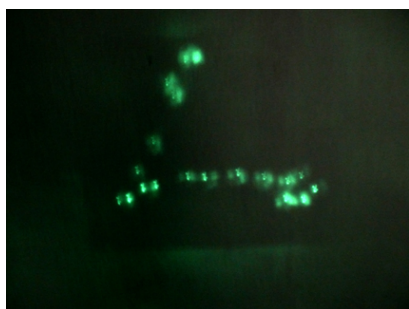
Constellation du Poisson