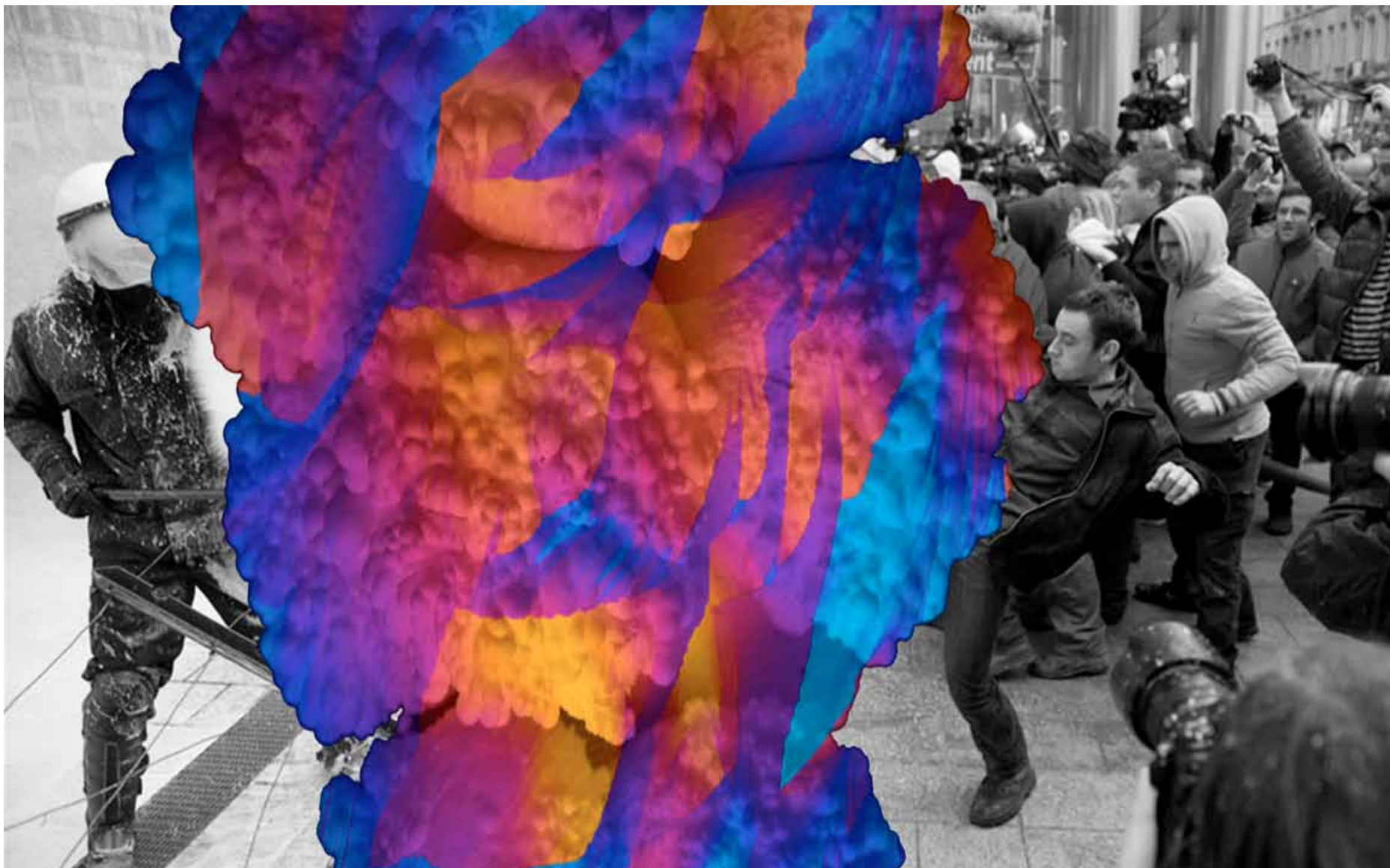
TUE GREENFORT TG/P 97/00 — Milk demonstration, 2014