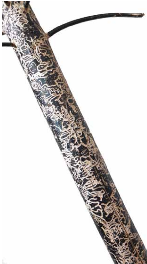
xylo, 2013 (détail) épicéa blanchi et encre à taille douce, dimensions variables

Ayant bénéficié du programme de résidence à Berlin proposé par le CEAAC, l'artiste François Génot sera simultanément exposé à l'Espace international du CEAAC.