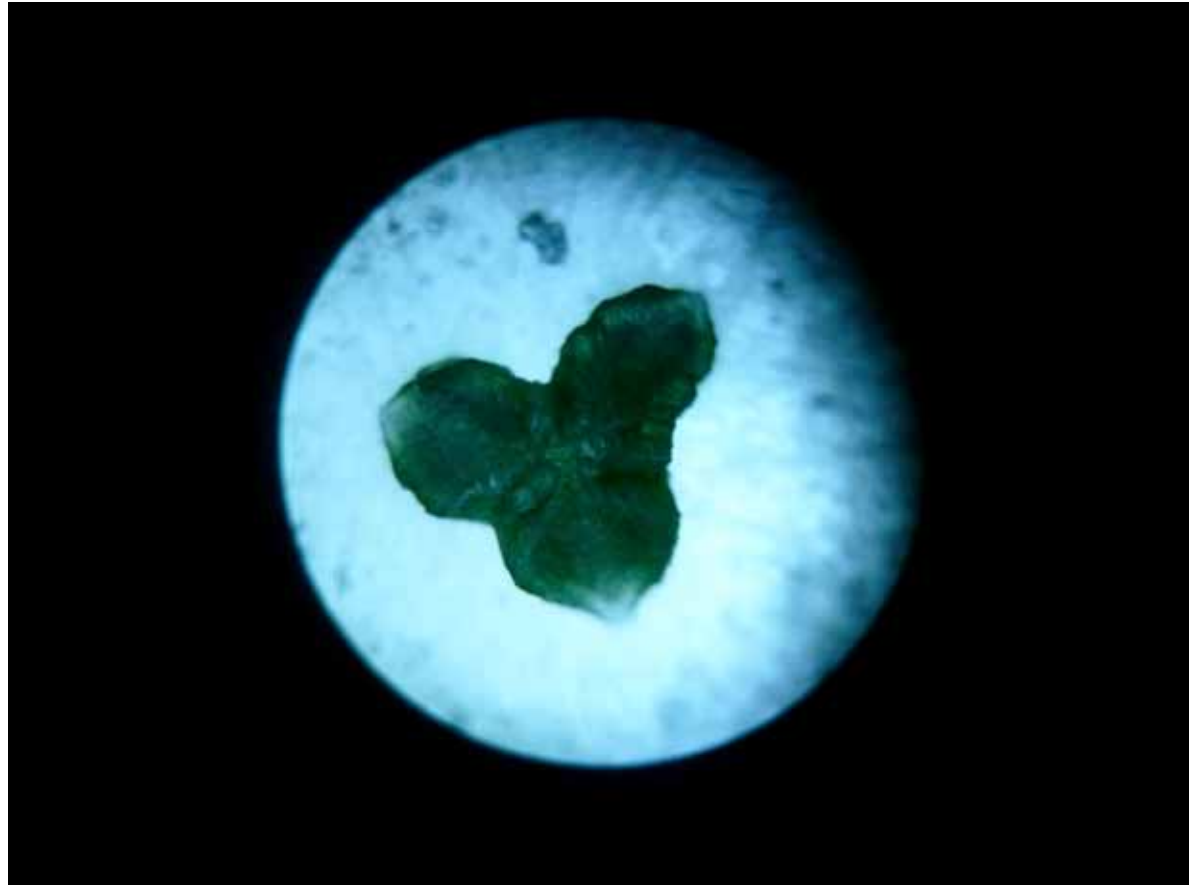
Amas de phytoplancton - Recherche préliminaire de l'œuvre Being with, 2015

Le travail d'Hanna Husberg évolue entre une pratique de la vidéo et des projets d'installations visuelles et sonores mettant en jeu divers aspects de notre perception physique et visuelle. Ses œuvres investiguent notre perception de l'environnement au temps de l'Anthropocène et du changement climatique, de l'étude des interventions humaines sur la météorologie à la création d'un véritable fonds artistique et documentaire autour de la disparition progressive de la République des Maldives liée aux effets du réchauffement climatique.