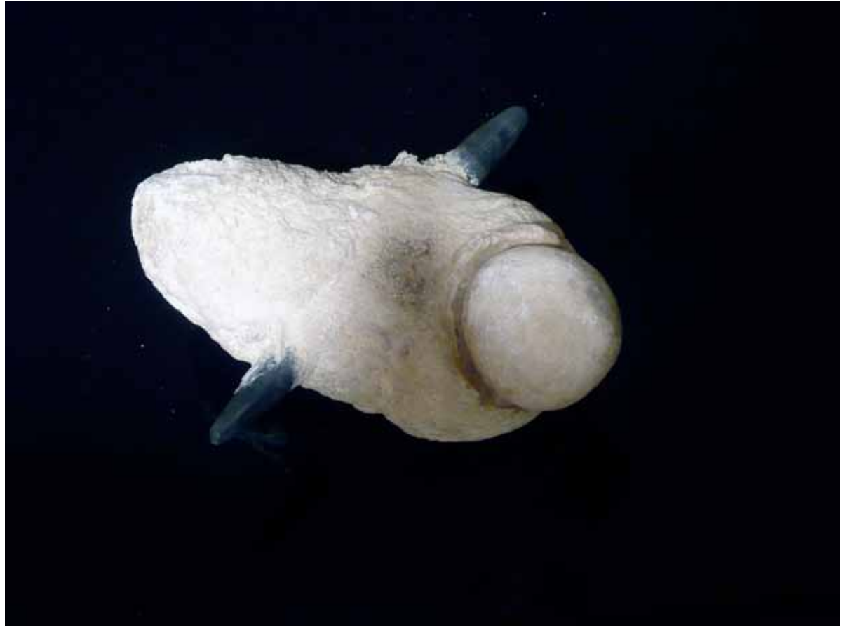
I.55_Spécimen pathologique, 2012, Prêt de St Bartholomew Pathology collection, Londres Courtesy Anaïs Tondeur et GV Art gallery

Son travail artistique s'appuie sur une exploration de l'interface entre faits et fiction, art et science, mémoire et perception, espace et temps. Dans une pratique dominée par les techniques de dessins et de la photographie anciennes, d'installations et des nouveaux médias, son travail met en récit des questions liées à l'évolution des savoirs et à l'impact de l'humain sur son environnement, au travers d'expéditions réelles ou fictives. À cette fin, elle collabore avec des scientifiques dans les domaines de la physique, des sciences de la terre et de l'espace mais également avec des compositeurs, écrivains et artistes.