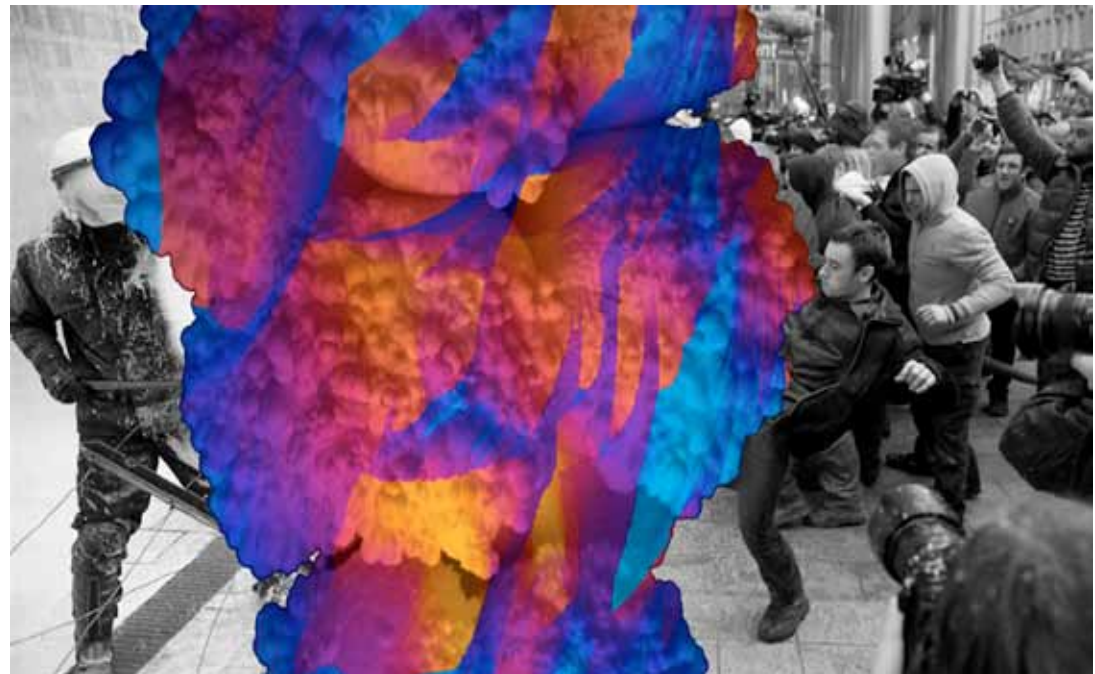
Milk demonstration, TG/P 97/00 2014