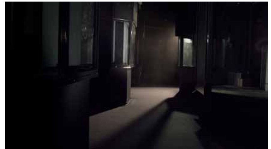
La Mesure Minérale, 2012