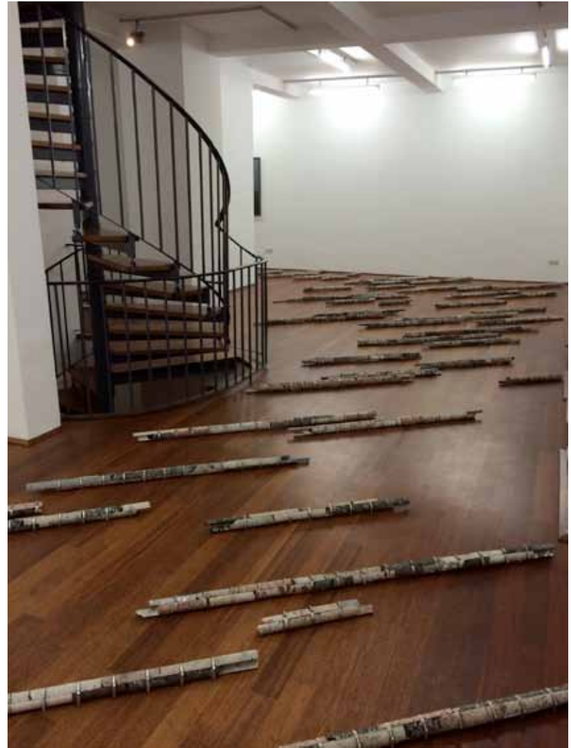
On The Sidewalk 2014