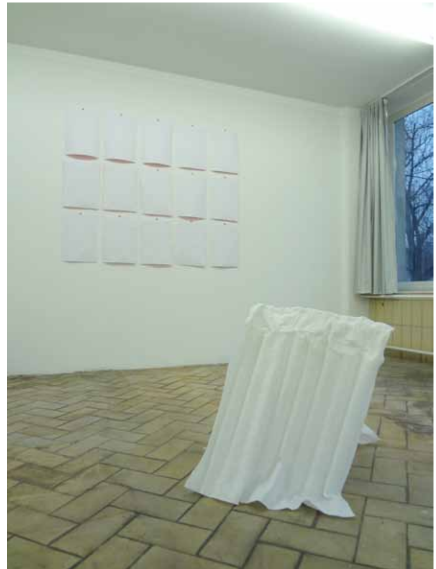
Ecume 2013 Non-tissé, durcisseur textile, peinture acrylique 64cm x 53cm x 60cm