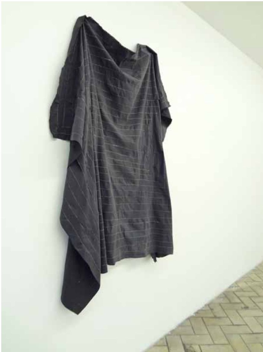
Cut up Sew up 2013 Coton, lurex 148cm x 187cm