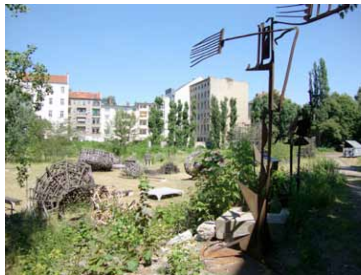
Jardin de la résidence à Berlin / Wedding