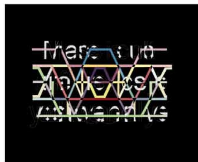
GHOST WORDS Série de trois peintures sous-verre 150 cm x 122 cm