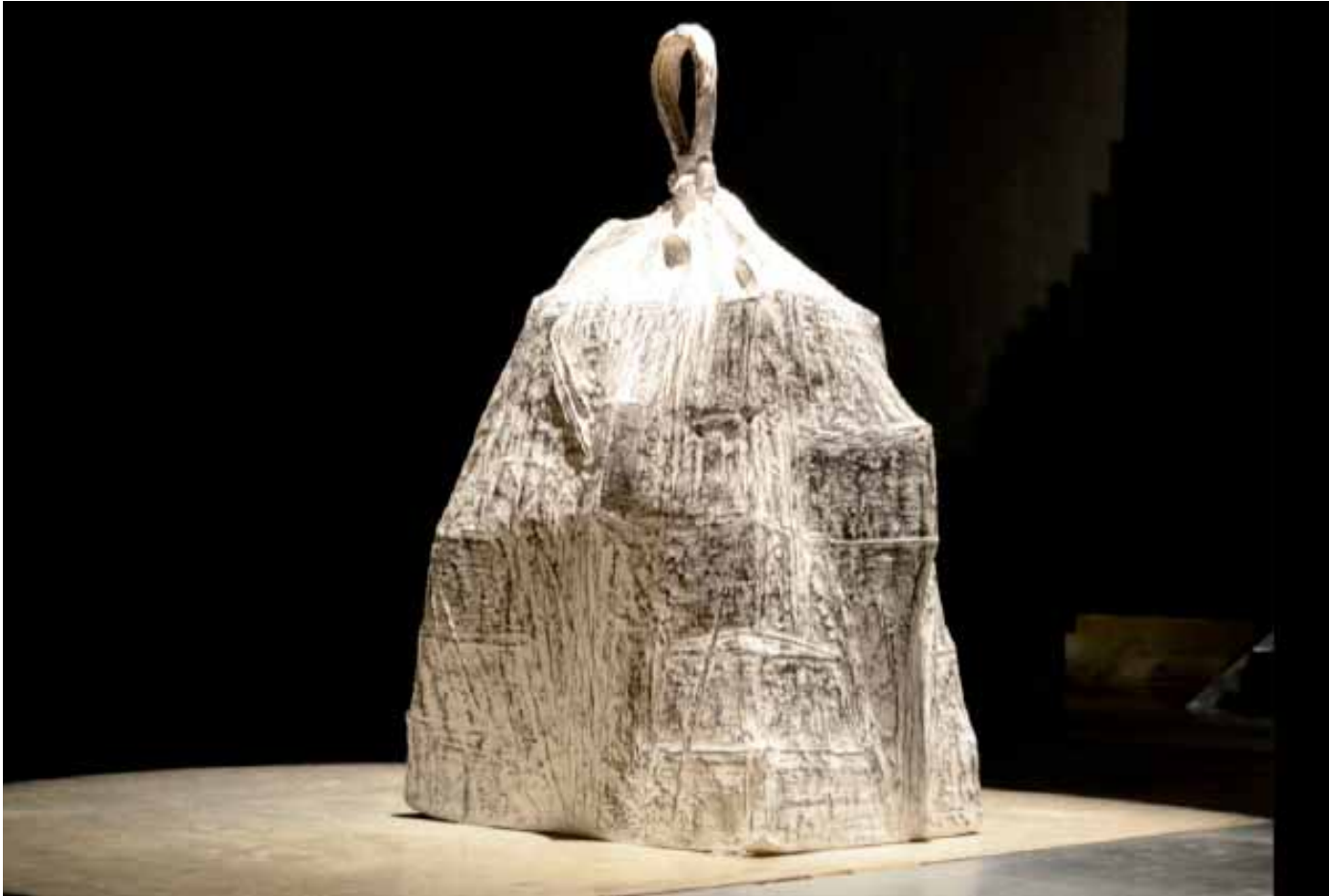
WRAPPED UP STORIES sculpture en résine, peinture, graphite 60cm x 100cm